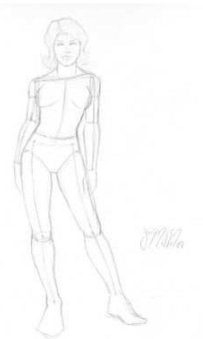
Corpo humano pela lei da perspectiva