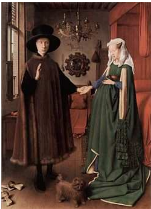
O casal Arnolfini (1434) de Jan van Eyck

Perspectiva (Michaelis): Arte de figurar, no desenho ou pintura, as diversas distâncias e proporção que têm entre si os objetos vistos a distância; Representação sobre um plano os objetos com todas as modificações aparentes, ou com os diversos aspectos que a sua posição determina com relação à figura e à luz; Pintura que representa jardins ou edificações em distância; Desenho que representa os objetos tais como se apresentam à nossa vista.