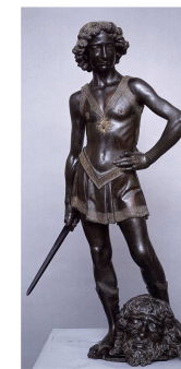
Davi de Donatello (1430 - Bronze)