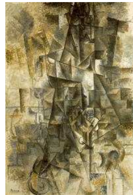
"Acordeonista" (1911) de Pablo Picasso