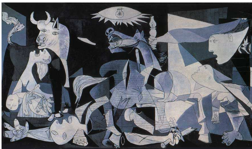
"Guernica" (1937) de Pablo Picasso

Em 1936, durante a Guerra Civil Espanhola, a Alemanha Nazista aproveitou o conflito para testar suas bombas. Os nazistas bombardearam várias cidades espanholas, entre estas cidades estava Guernica. Horrorizado com a guerra, Picasso retratou o bombardeio a esta cidade: