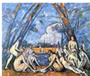
Baigneuses (1906) Cézanne