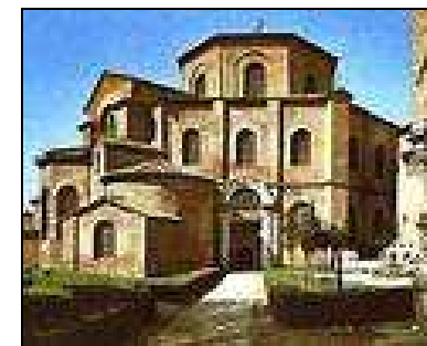
Igreja de São Vital (Ravena)

O destaque da arquitetura bizantina é, sem dúvida, a Igreja de Santa Sofia em Constantinopla, hoje Istambul, no interior desta igreja existem centenas de mosaicos e vitrais com cenas dos Evangelhos.