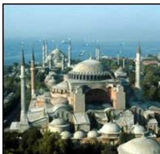
Igreja Santa Sofia (Istambul)